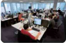
D1 (720 x 480)